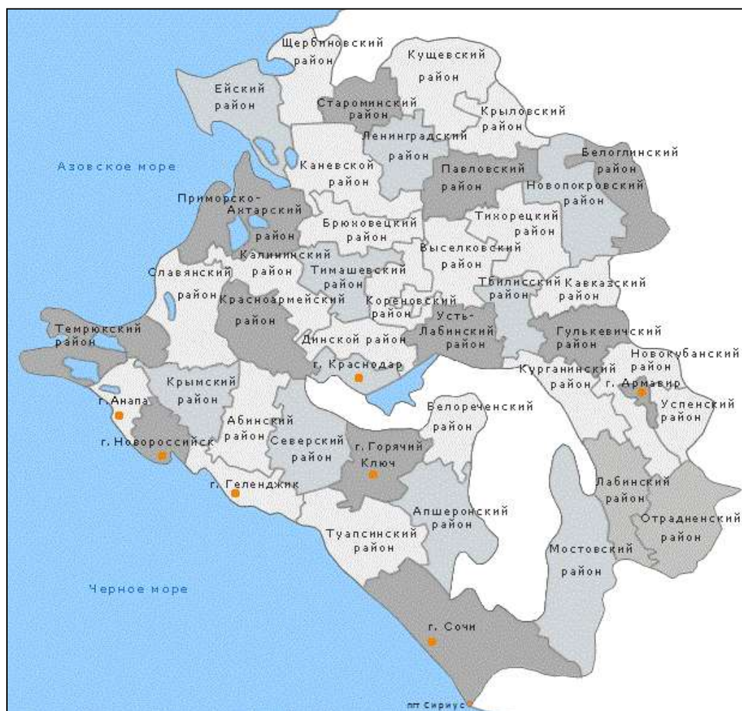
Рисунок 1 – Карта Краснодарского края

Одним из самых главных преимуществ региона является его выгодное географическое расположение (выход к Черному и Азовскому морям). Карта Краснодарского края представлена на рисунке 1.