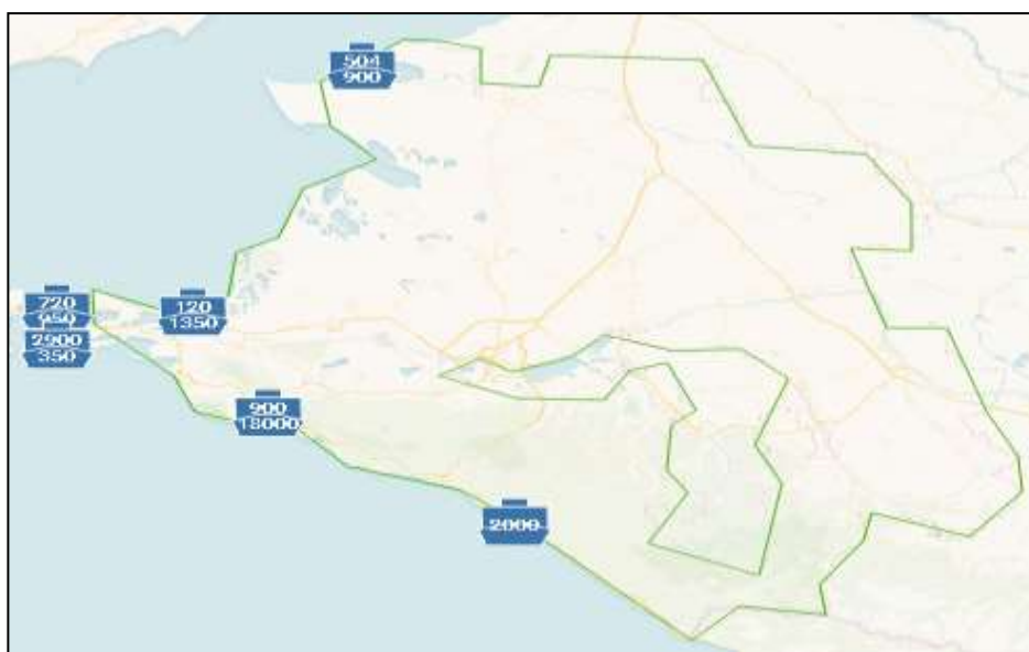
Рисунок 2 – Морские порты Краснодарского края

Агропромышленный комплекс Краснодарского края, обладающий значительной агроемкостью и характеризующийся благоприятными природно-климатическими условиями, занимает центральное место в структуре аграрной экономики Российской Федерации. В контексте введения западных санкций, аграрные предприятия данного региона столкнулись с необходимостью адаптации к изменившимся экономическим условиям, что потребовало пересмотра стратегий функционирования и внедрения инновационных подходов в управлении развития масложировой индустрии.