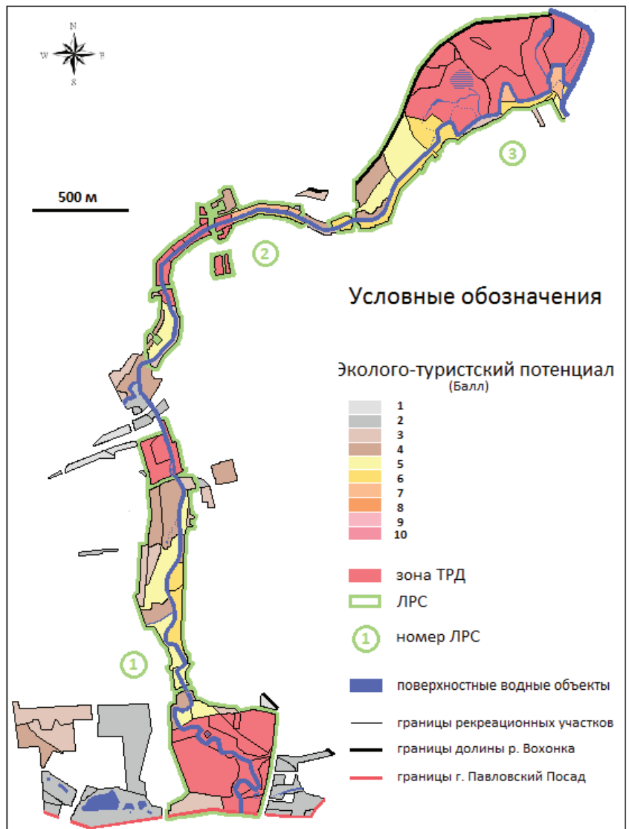
Рисунок 3. Эколого-туристский потенциал долины реки Вохонка в границах города Павловский Посад Figure 3. Ecological and touristic potential of Vokhonka River valley within boundaries of Pavlovsky Posad city