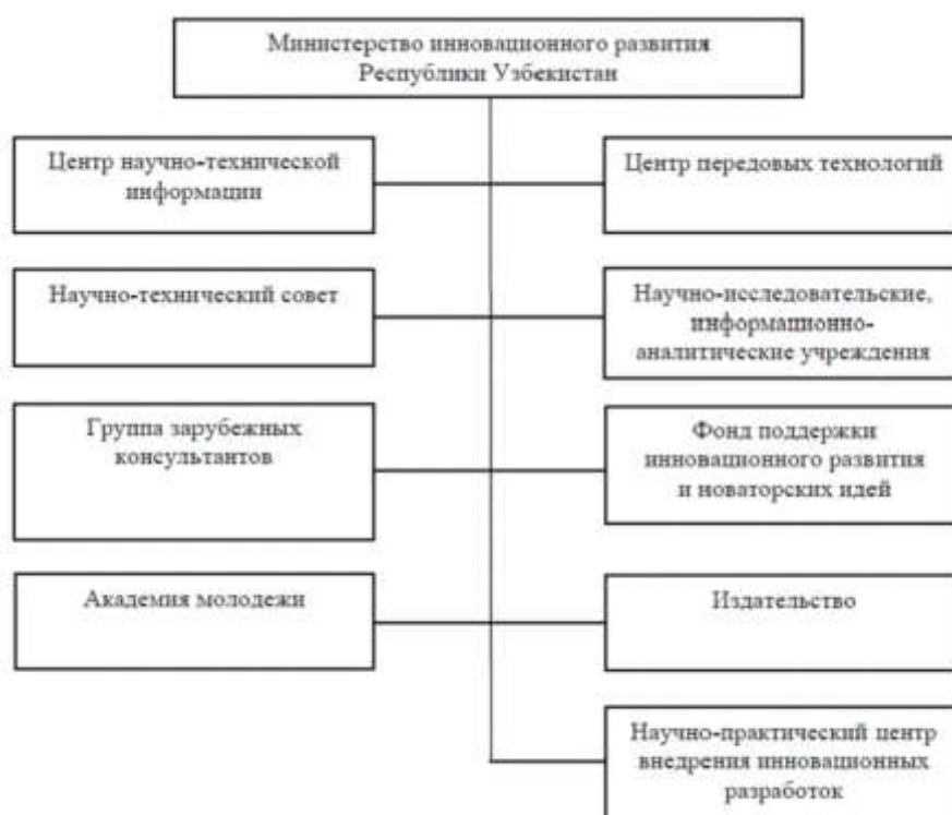
Рисунок 1 – Организационная структура министерство инновационного развития Республики Узбекистан

Правовая безопасность является основой для правильной организации, регулирования и создания эффективной системы управления предпринимательской деятельностью, легкой или тяжелой промышленностью, услугами, занятостью в торговле и других сферах. Соответственно, система закупок в стране также является организационной структурой через определенные важные законы, подзаконные акты, специальные правила, приказы, указы и распоряжения, кодексы и другие нормативные акты, издаваемые соответствующими органами власти или президентом, участие в ней, ее управление, контроль и регулирование, определение современных тенденций и их применение на практике представлены на правовой основе. Это, в свою очередь, является единственной поддержкой государства для оптимального и эффективного правового управления отраслью. Ниже представлена государственная система управления инновационными проектами (рисунок 1).