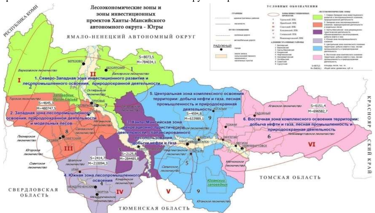
Рисунок 2. Карта зон инвестиционного развития и лесопромышленного освоения Ханты-Мансийского автономного округа-Югры

На рисунке 2 представлена карта лесозаготовительных зон и зон инвестиционных проектов Ханты-Мансийского автономного округа-Югры.