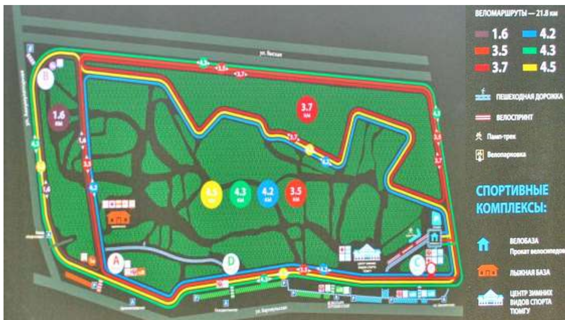
Рисунок 6. Схема лесопарка Затюменский

Вследствие развития в городах промышленной деятельности, увеличения транспортных потоков для городских ООПТ характерно акустическое загрязнение, снижение качества атмосферного воздуха, а также присутствие людей на ООПТ приводит к беспокойству представителей животного мира.